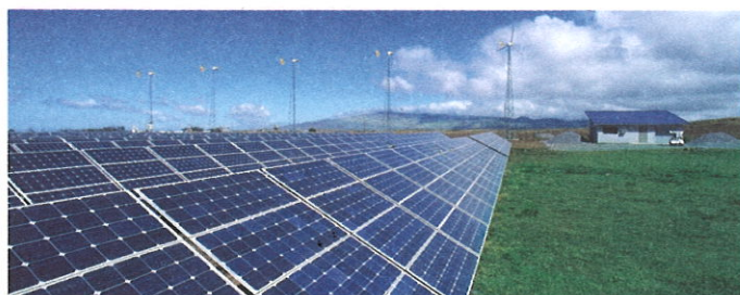
Запобігання кліматичним змінам | Розвиток відновлюваних джерел енергії

Ми надаємо консультативну допомогу при упровадженні систем управління життєвим циклом продукції на основі стандартів серії ISO 14000. Також ми проводимо оцінювання еколого-економічних аспектів виробництва та продукційної системи у цілому, що надає уяву про ефективність системи управління, безпеку виробництва, раціональне використання ресурсів та є основою для стратегічного планування.