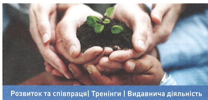
Розвиток та співпраця | Тренінги | Видавнича діяльність

Ми проводимо дослідження, спрямовані на сприяння припиненню втрат біологічного та ландшафтного різноманіття та формуванню екологічної мережі, забезпеченню екологічно збалансованого природокористування. Сталий розвиток природно-заповідних територій є одним з пріоритетних напрямів нашої діяльності.