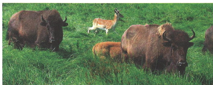
Збереження біорізноманіття | Сталий розвиток природоохоронних територій

Ми аналізуємо динаміку розвитку різних галузей економіки в Україні і в світі та підтримуємо заходи державної екологічної політики в напрямку розвитку сталого споживання та виробництва в державному та приватному секторах економіки. Ми надаємо консультації щодо здійснення зелених закупівель, розвитку комунікації, підготовки не фінансових звітів та «зеленого маркетингу».