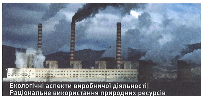
Екологічні аспекти виробничої діяльності | Раціональне використання природних ресурсів

На основі міжнародних стандартів ми здійснюємо кількісну оцінку, моніторинг та підготовку звітної документації на проекти скорочення викидів парникових газів або збільшення їх видалення. Ми надаємо рекомендації щодо упровадження технологій більш чистого виробництва та допомагаємо суб'єктам господарювання у пошуку «зелених інвестицій».